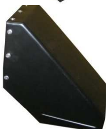
Auswurf ohne Blech Art. Nr.: 40/46