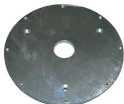
Motorflansch Innenteil BR20 ab April 2017; Maschine 16170145 Art.Nr.: 40/84