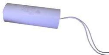
Kondensator 50 \mu Art.Nr.: 49/23