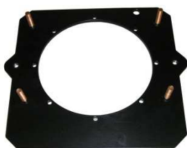
Motorflansch Außenteil BR20 ab April 2017; Maschine 16170145 Art.Nr.: 40/80