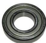
Rillenkugellager Motor-Seite Ø24 Art. Nr.: 49/12