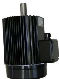
Motor Art.Nr.: 41/09