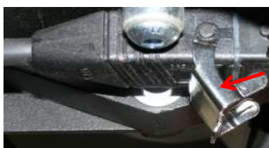
Wiedereinschaltperre Bügel Art. Nr.: 40/54