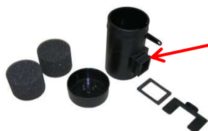
Kondensatorrohr mit Schaumstoffeinsatz und Deckel Anschluss eckig Art.Nr.: 49/24