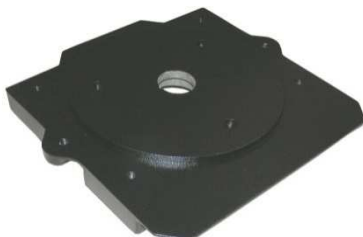
Motorflansch BR20 bis Oktober 2016; Maschine 42160119 Art.Nr.: 40/06