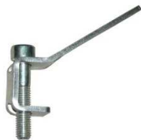
Kegelstop Art.Nr.: 41/70