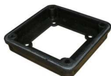
Zwischenstück zwischen Klemmbrettkastenunterteil und Motorschutzschalter Art.Nr.: 49/18