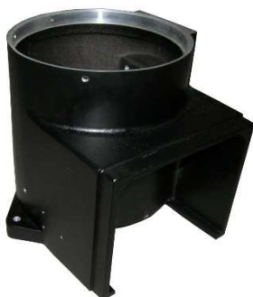
Gehäuse Art. Nr.: 40/28