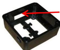
Klemmbrettkastenunterteil Anschluss eckig Art. Nr.: 49/17